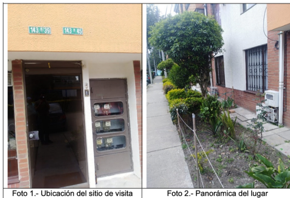
Foto 1.- Ubicación del sitio de visita