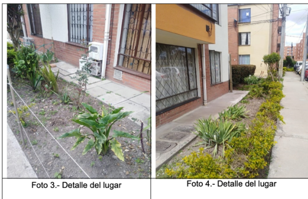
Foto 3.- Detalle del lugar